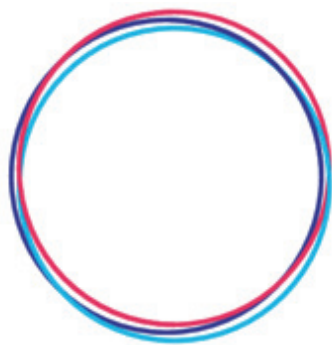
「一人ひとりの社員が主役！」と謳っている 「BIPROGY グループ人財戦略レポート」表紙のマークです

LGBTQの尊厳と理解・共感を象徴するカラーとして世界的に使用されている6色の虹と、LGBTQ支援者であることを表す「I am an Ally」の文字を組み合わせたオリジナルのAllyステッカーの希望者への配付、ステッカーのモチーフが入ったオンライン背景の提供をしています。